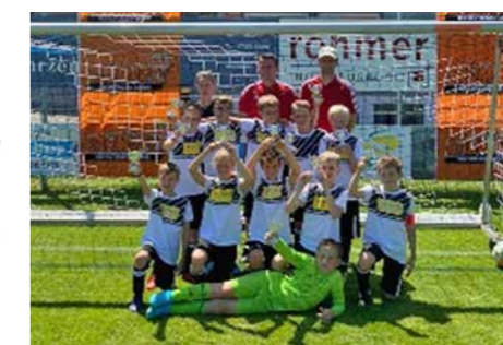
Beim Turnier in Schwendi belegten wir den 5. Platz.

Am Saisonende nahmen wir noch an mehreren Pokalturnieren in Eberhardzell (4. Platz / 8. Platz), Schwendi (5. Platz), Erolzheim (2. Platz), KiBlegg (1. Platz), Haslach b. Wangen (2. Platz) teil.