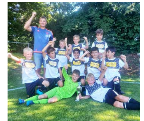
Beim Turnier in Erolzheim mussten wir uns im Finale im Elfmeterschießen geschlagen geben.