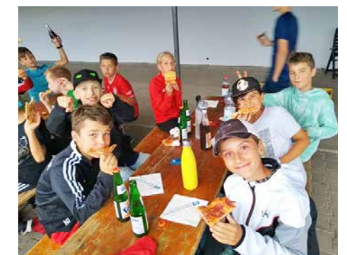
Zum Saisonende veranstalteten wir ein Abschlussfest am Haslacher Sportplatz. Nach einer kleinen Wanderung gab es leckere Pizza und Getränke.