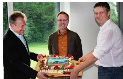
Die Gemeinde gratuliert zum Neubau mit einem künstlerisch verzierten Kuchen

stellt. Ein Crowdfunding über die Volksbank Allgäu-Oberschwaben wurde mit 7 T€ erfolgreich abgeschlossen; weitere 4 T€ Zuschüsse folgten für den Bau und die Einrichtung. Der Förderverein des TSV Aitrach, der die PV-Anlage auf den Sporthallen betreibt, hat 50 T€ zum Bauvorhaben beigetragen.