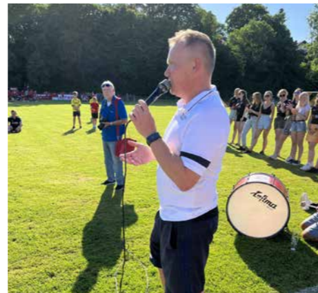
Auch die 2. Mannschaft wurde Erster in der Gruppe, am 29.05.2022