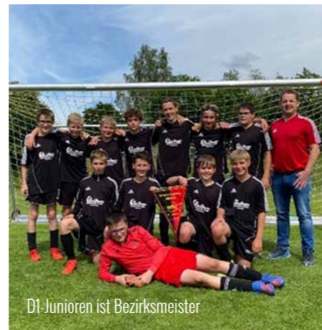
D1 Junioren ist Bezirksmeister

Ende Mai 2022 reisten die Spieler der D1 mit ihren Eltern und Unterstützer als Tabellenweiter mit einem Punkt Rückstand zum Tabellenführer nach Eberhardzell. Um den Meistertitel mit nach Hause zu nehmen, war also ein Sieg notwendig. Gleich nach dem Anpfiff nahm das Spiel volle Fahrt auf. Deutlich war sowohl den Spielern als auch den Trainern anzumerken, dass beide Seiten zwingend den Titel holen wollten. In einem temporeichen Spiel kam es zu zahlreichen Torchancen auf beiden Seiten. Im letzten Drittel spielten beide Mannschaften mit offenem Visier und jedes Ergebnis wäre denkbar gewesen. Der Endstand lautete 2:1 für die SGM.