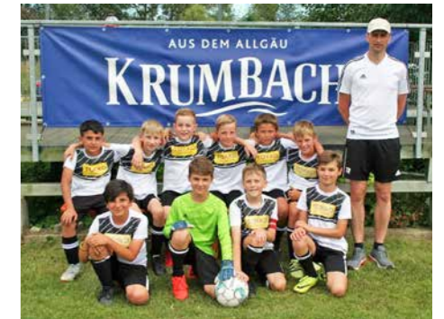
Die SGM Iller/Rot belegte beim Krumbach Cup in KiBlegg den 1. Platz.