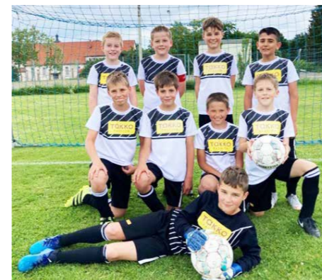
Die E1 beim Spiel gegen den FV Olympia Laupheim II

Besonders bitter war das Ausscheiden im Viertelfinale des Bezirkspokals mit einer Niederlage im Elfmeterschießen gegen die SGM SV Eberhardzell I. Trotz bester Torchancen scheiterte man immer wieder an der Latte, dem Pfosten und dem gegnerischen Torwart.