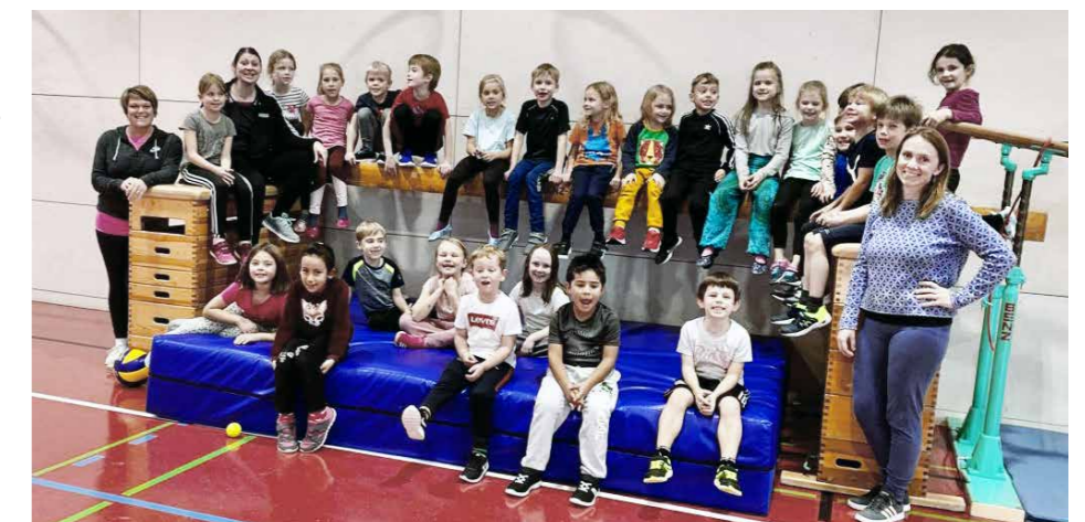
Gruppenbild der PowerKids II vom 24.11.2022

Die Power-Kids, die seit vielen Jahren ein fester Bestandteil im Breitensport und der Jugendarbeit sind, starten wieder mit drei Gruppen.