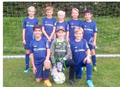
Die E1 mit neuen Trikots, gesponsert von der Firma Lämmle aus Rot a. d. Rot.

Mit 34 Kindern und 4 Trainern startete die E-Jugend der SGM Iller/Rot nach einem ersten Kennenlern-Training Ende August in die neue Saison. Auf Grund der großen Anzahl an Kindern konnten, wie bereits in den Vorjahren, wieder 3 Mannschaften für den Spielbetrieb angemeldet werden. Sämtliche Heimspiele der Vorrunde fanden hierbei in Aitrach statt.