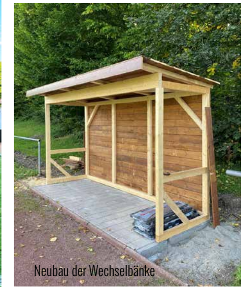
Neubau der Wechselbänke