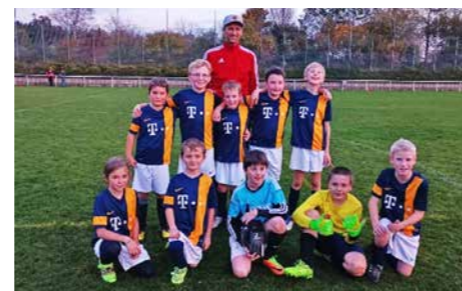
Die E3 beendete die Vorrunde der Saison 2022/2023 mit einem 2:2-Unentschieden bei der SGM SG Mettenberg III.

nen Saisonstart mit einem 5:2 Sieg gegen die SGM SF Schwendi III folgten Niederlagen gegen den FC Inter Laupheim (7:1), die SGM TSV Ummendorf II (0:12) und die SGM SV Schemmerhofen II (5:3). Am 5. Spieltag konnte in Aitrach die SGM TSG Achstetten III mit 7:3 besiegt werden. Eine weitere Niederlage gegen die SGM SV Schemmerberg (0:9) und ein Unentschieden zum Vorrunden-Ende bei der SGM SG Mettenberg III (2:2) bedeuteten am Ende einen respektablen Tabellenplatz im Mittelfeld in der Quali-Staffel 7.