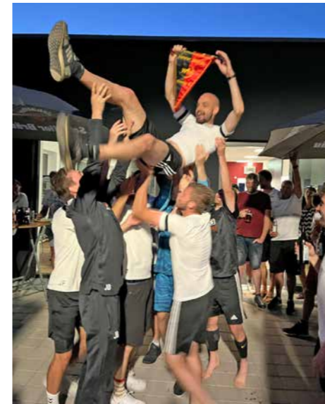
Pokalfinale: TSV Tettng II - SGM Aitrach/Tannheim 5:1 (2:1)

Das Pokalfinale gegen den TSV Tettng II fand am 26.05.22 in Grünkraut statt. Unsere Damen haben sich wacker geschlagen, doch leider konnten sie den Pokal nicht nach Hause holen.